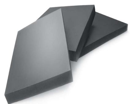
LASTRE IN EPDM ESPANSO