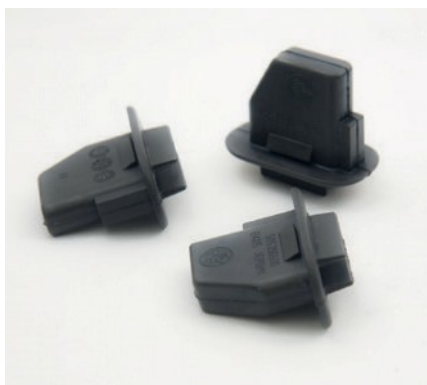
GOMMINI DI FISSAGGIO