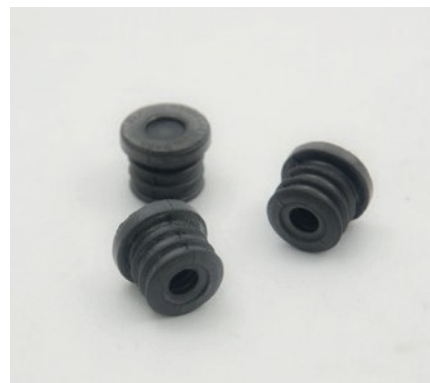
GUARNIZIONI ASTA OLIO