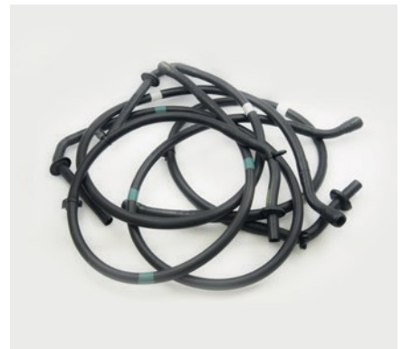
TUBI DRENAGGIO ACQUA