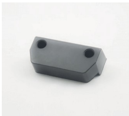
TAMPONE ARRESTO PORTA