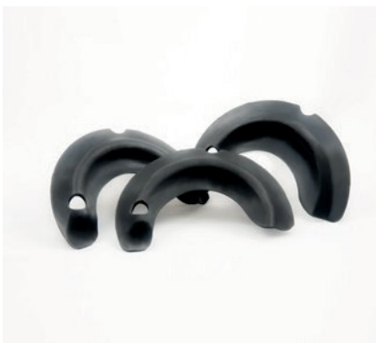
ANTIVIBRANTI PER SISTEMI SOSPENSIONE