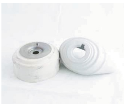
CUFFIA DI PROTEZIONE CALORE