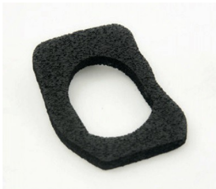
GUARNIZIONE IN MATERIALE ESPANSO