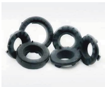
ANTIVIBRANTI PER SISTEMI SOSPENSIONE