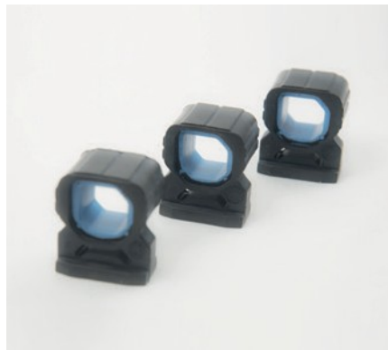
TASELLI SUPPORTO RADIATORE