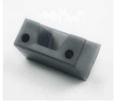
TAMPONE ARRESTO PORTA