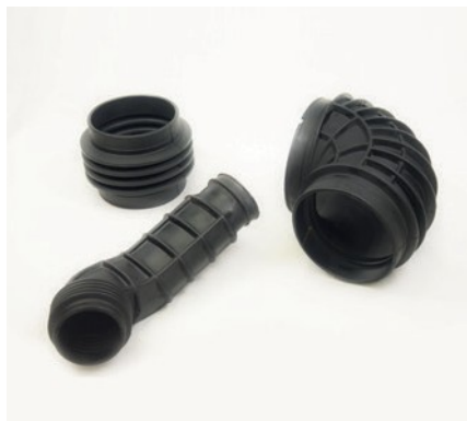
SOFFIETTI GRANDI DIMENSIONI PER VEICOLI INDUSTRIALI