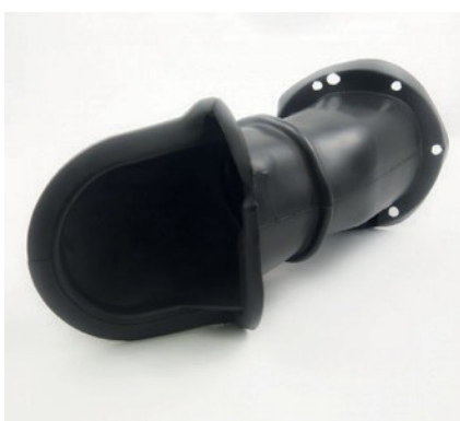
GUARNIZIONE INTRODUZIONE CARBURANTE