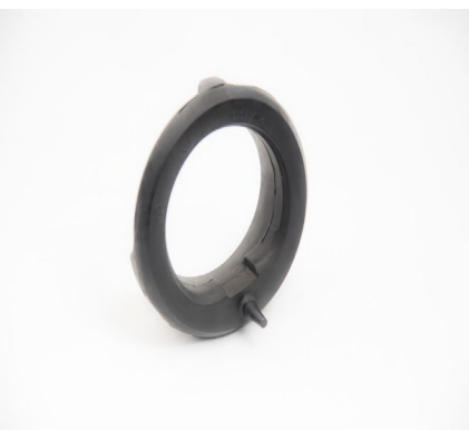
ANTIVIBRANTE PER SISTEMI SOSPENSIONE 4