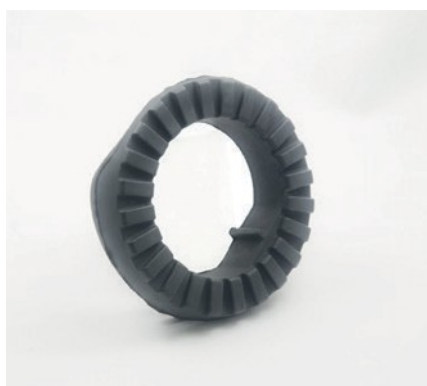
ANTIVIBRANTE PER SISTEMI SOSPENSIONE