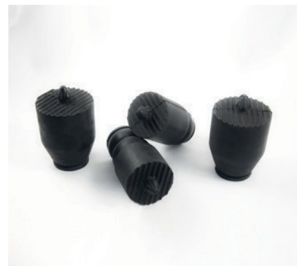
ANTIVIBRANTI PER SISTEMI SOSPENSIONE