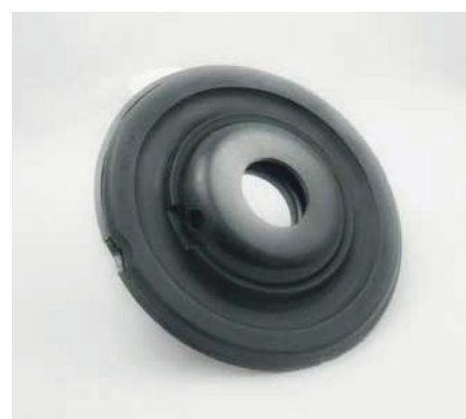
ANELLO APPOGGIO MOLLAPER SISTEMI SOSPENSIONE