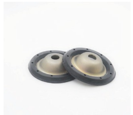
PIATTELLI DI TAMPONAMENTO