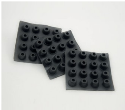
TASSELLI DI BATTUTA