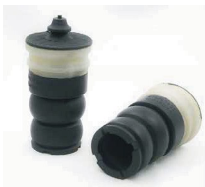
ANTIVIBRANTI PER SISTEMI SOSPENSIONE