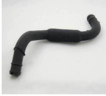
TUBO SFIATO VAPORI CON GUAINA DI PROTEZIONE