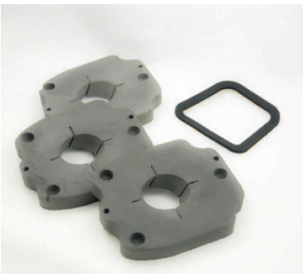
GUARNIZIONI IN MATERIALE ESPANSO