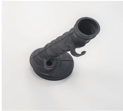
MANICOTTO SCATOLA FILTRO